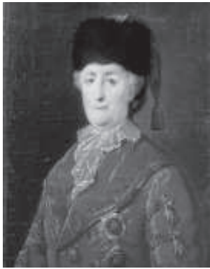
Шибанов М.И. Портрет Екатерины II в дорожном костюме. 1787.

стью в то время. Кроме того, Императрица предстает с высшими российскими орденами на груди. На обороте портрета сохранился надпись: «Писал М.П. Шибанов в Киеве, в 1787-м году месяце апреле».