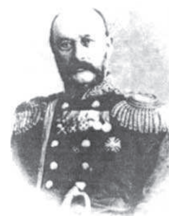
Князь Уцмиев Хасайбек

Заключая, хотел бы еще раз отметить, что это всего лишь первая попытка объединить доступную документальную информацию о кумыках-кавалерах русских императорских наград. По мере накопления информации список этот, вне всякого сомнения, будет дополняться. Но уже на сегодня мною собран обширный материал для книги о воеводах и офицерах из числа кумыков, посвятивших себя служению России, и она запланирована к выпуску под названием «Кумыки на службе России».