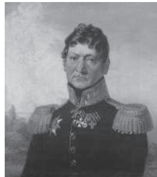
Генерал-лейтенант барон Андрей Андреевич фон Засс

На портрете в Военной галерее Зимнего дворца Андрей Андреевич фон Засс изображен в общегенеральском кавалерийском мун-