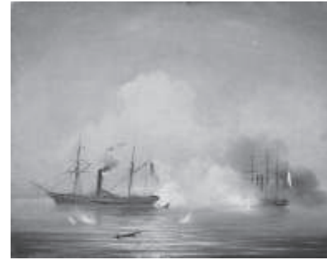
Айвазовский И. К. Морской бой. 1855.

ние на командные и административные должности самых одаренных талантами подданных во всех областях государственной деятельности позволили достичь России внушительных успехов и, прежде всего, в военной области, что, разумеется, и относится к «мудрым для службы советам», подходящим под орденовый статут.